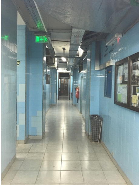
Un pasillo de la escuela

8h, rendez-vous au lycée.” Pas très dépaysant me diriez-vous? Et pourtant, c’est ainsi que commence notre première journée à Buenos Aires. Après avoir assisté à un cours d’histoire économique (non, ce n’est pas un poisson d’avril), nous commençons la visite de l’école à 10h30. De la classe de chimie à la salle informatique, en passant par une démonstration de musique très appréciée, nous mettons 1h30 à faire le tour du ”Pelle”. 2 détails retiennent notre attention : la taille de l’établissement et la quantité de peintures, graffitis et autres décorations dans ses couloirs.